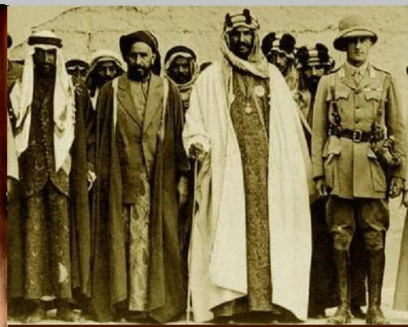
من اليمين -مستر بل المقيم البريطاني في الخليج، الملك عبدالعزيز بن سعود، السلطان خزعل بن جابر أمير الأحواز وأمير الكويت في أول اجتماع قمة خليجية عام 1916 في المحمرة.