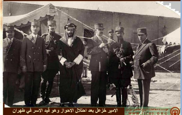
الامير خزعل بعد احتلال الاحواز وهو قيد الاسر في طهران